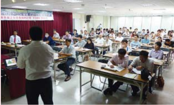
▲ 生技商機研討會實景