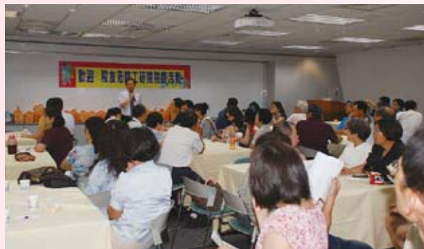
▲ 院友回娘家會場實景