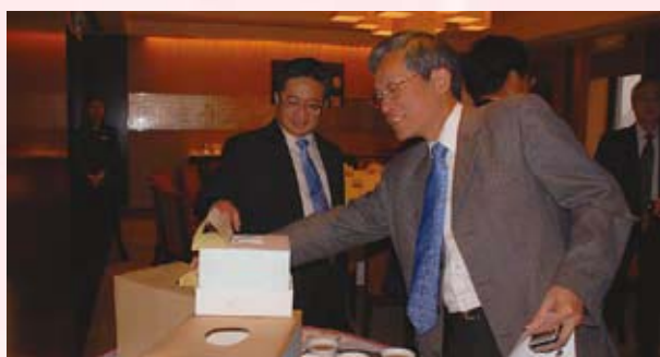
▲ 第四屆常務理監事及理事長選舉實景