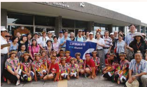
▲ 曾理事長、徐院長及理監事與沓互樂團原住民小朋友合影