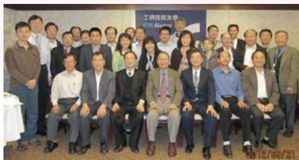
▲ 院友會中部地區會員新春餐敘晚宴合影