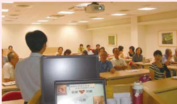
▲ 科技人身心健康講座-「低碳、健康、蔬食養生觀」演講實景