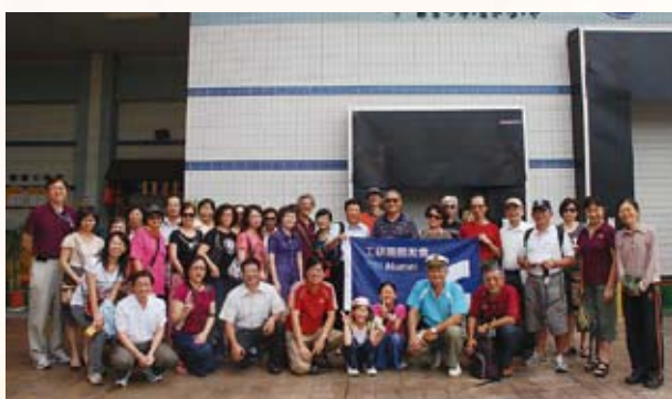
▲ 院友會員於朝露魚舖觀光工廠合影