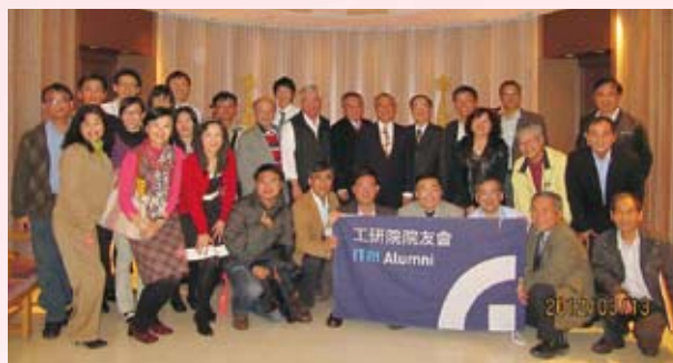
▲ 院友會南部地區會員新春餐敘晚宴合影