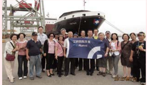
▲ 經建參訪—院友會員於台中港合影