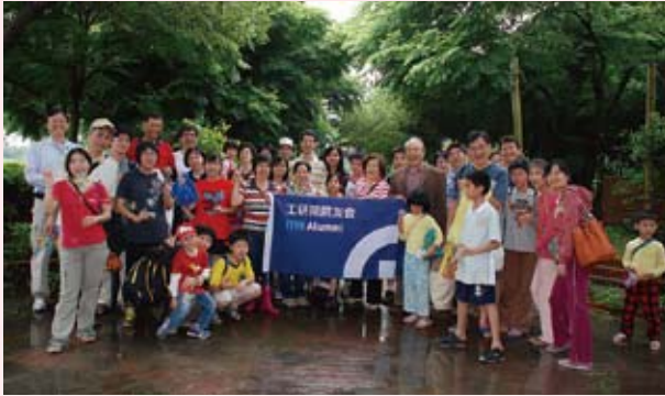
▲ 院友親子於東螺溪農場合影