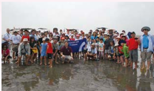
▲ 院友親子於彰化王功潮間帶合影