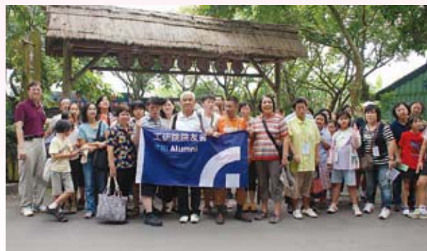
▲ 「公益單車親子逍遙遊」關懷活動合影