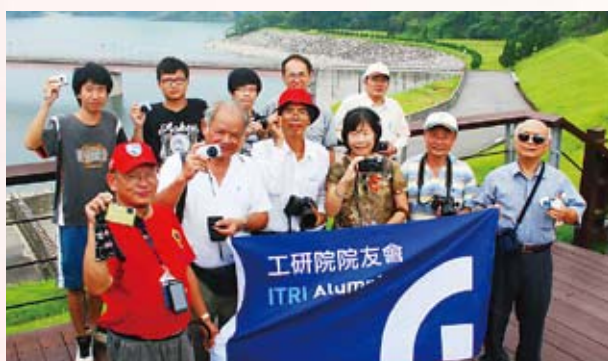
▲ 院友會員於寶山水庫前合影