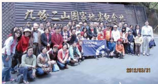
▲ 院友會員於九份二山國家地震紀念地合影