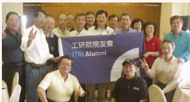
▲ 院友會、快樂隊與友達光電高爾夫球敘合影