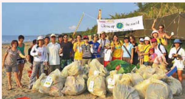
▲ Clean Up the World活動 (工研院愛兒社)