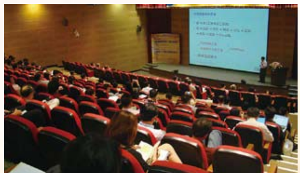
▲ 2012科技產業經營管理高峰論壇實景